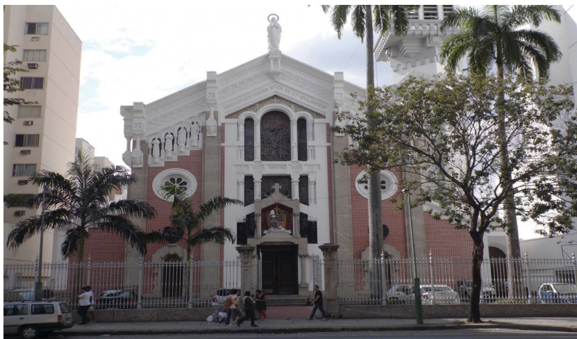
Foto 1: Fachada da Basílica de Nossa Senhora de Lourdes.