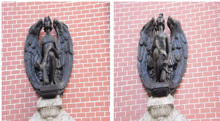
Fotos 6 e 7: Anjos acima dos portais laterais.