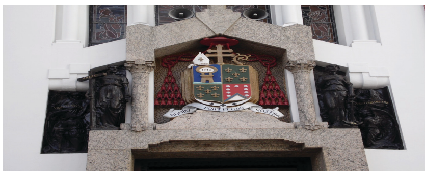
Foto 5: As alegorias da fé e da esperança e o brasão do Cardeal Arcoverde.