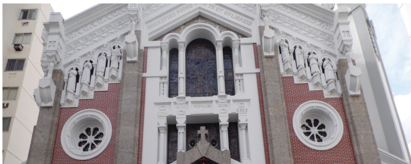
Foto 4: Fileiras das esculturas de santos e beatos.